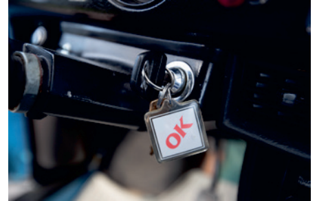
▲ Startnyckeln med en ikonisk nyckelring.