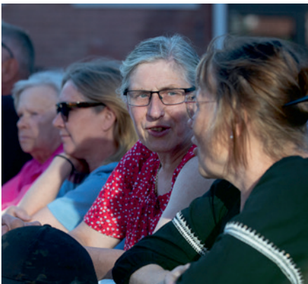
▲ Det här var ett kalas för alla åldrar.