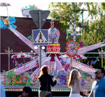
▲ Vem vill inte åka karusell upprupen i en turkos och rosa elefant?