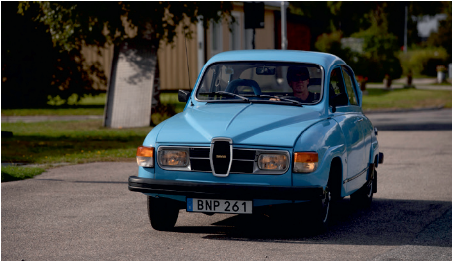
▲ Håll med om att Stefan Tanos lilla och 50 år gamla Saab är en färglick som man blir glad av.