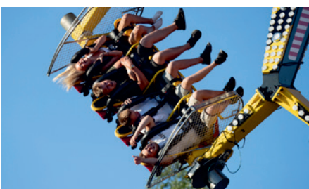
▲ Det gällde att stänga munnen så att inte tuggummi, godis – eller löständer – skickades ut i en omloppsbana.