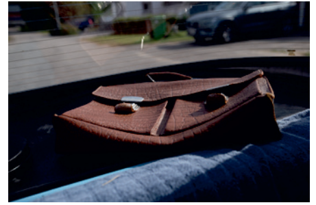
▲ Den gamla bandyportföljen passade fint på hatthyllan i baksätet.